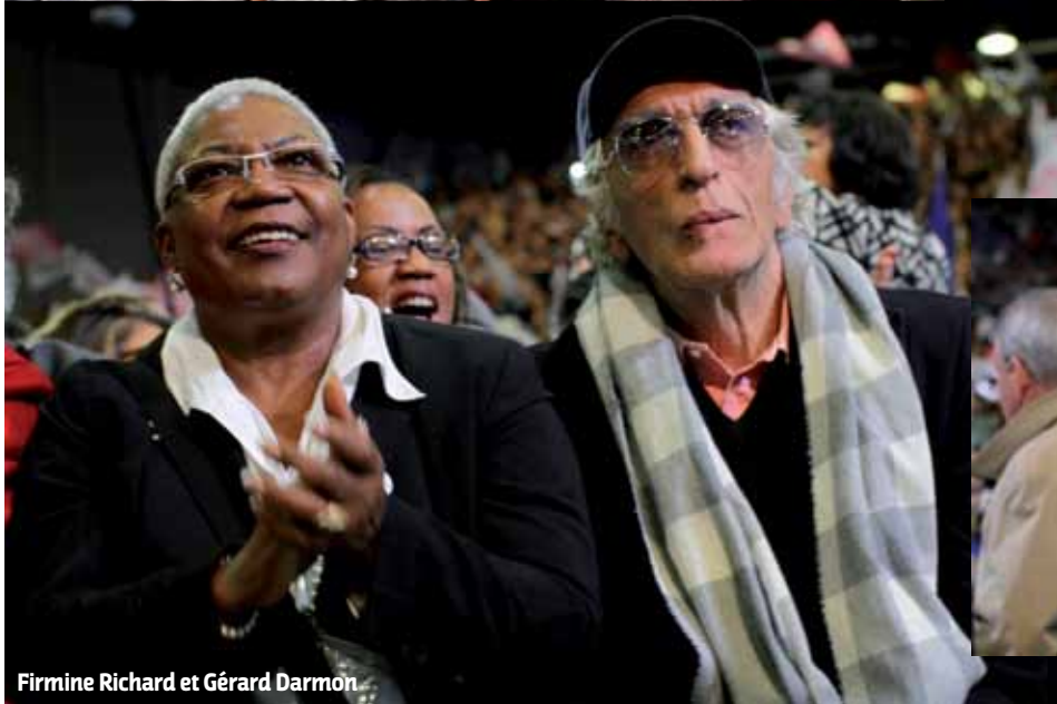
Firmine Richard et Gérard Darmon