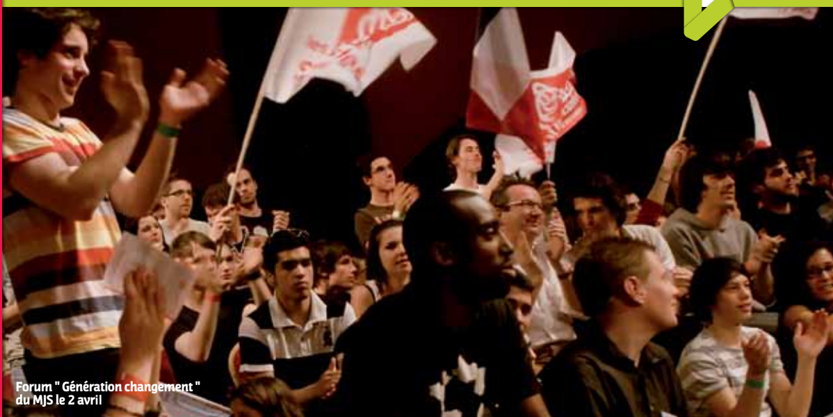
Forum " Génération changement " du MJS le 2 avril