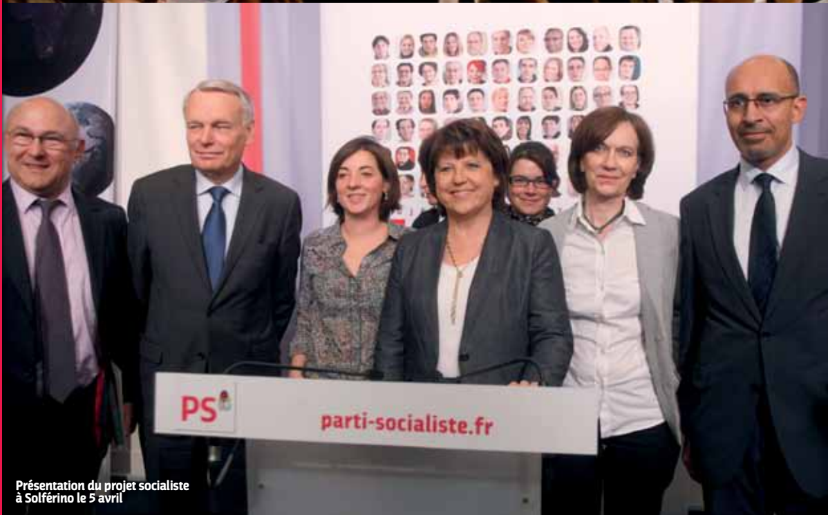
Présentation du projet socialiste à Solférino le 5 avril